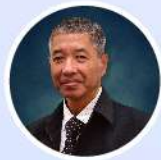
รศ.ดร.บุญวัฒน์ อัดชู (กรรมการสภามหาวิทยาลัยผู้ทรงคุณวุฒิ)