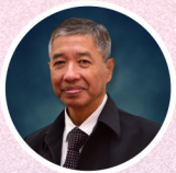
รศ.ดร.บุญวัฒน์ อิตชู (กรรมการสภามหาวิทยาลัยผู้ทรงคุณวุฒิ)